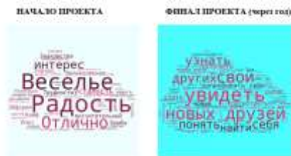
Рис. 1. Облако слов

показывает, как меняются, например, целевые установки детей, как происходит формирование их ценностей (Рис. 1).